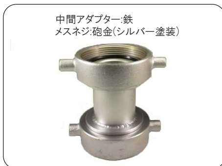
中間アダプター:鉄 メスネジ:砲金(シルバー塗装)