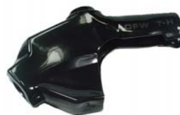
カバー 型番 8HBL-0400 色 ブラック