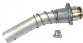
スバウトAssy 型番 5BH-5115 長さ 178mm