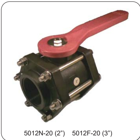
5012N-20 (2") 5012F-20 (3")