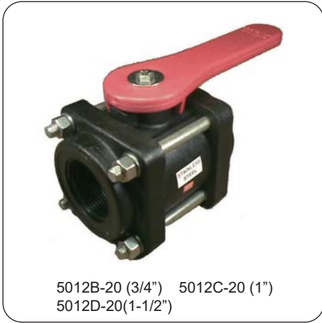
5012B-20 (3/4") 5012C-20 (1") 5012D-20(1-1/2")